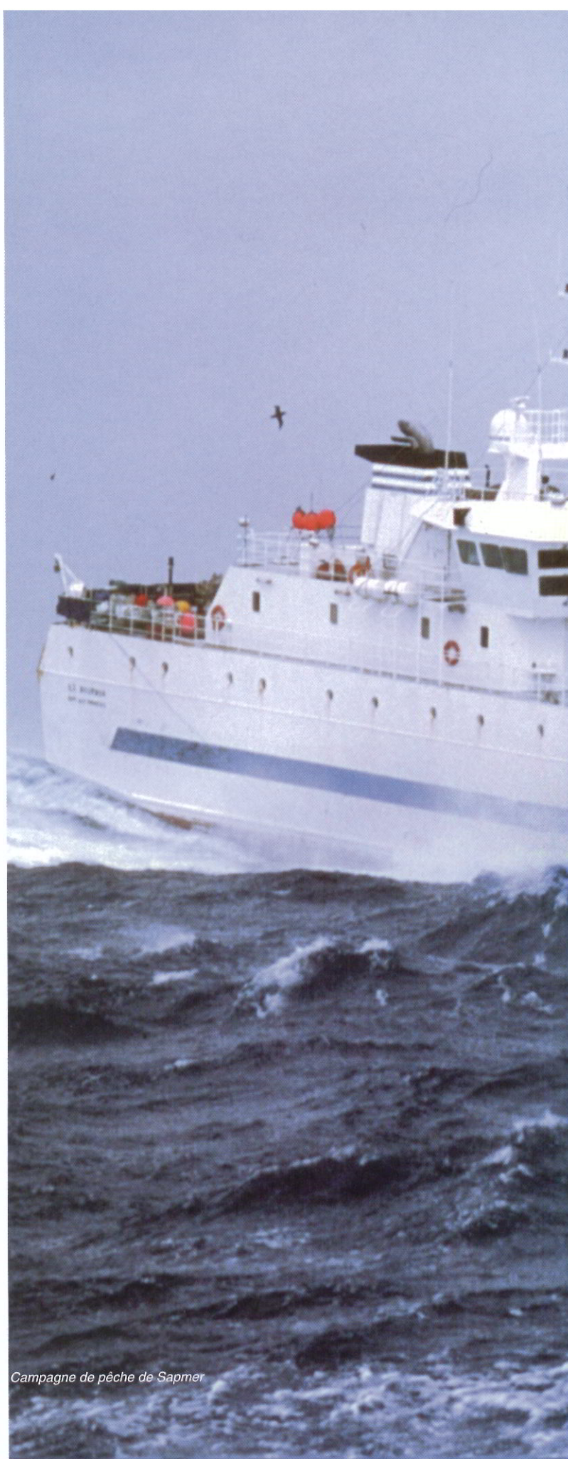
Campagne de pêche de Sapmer